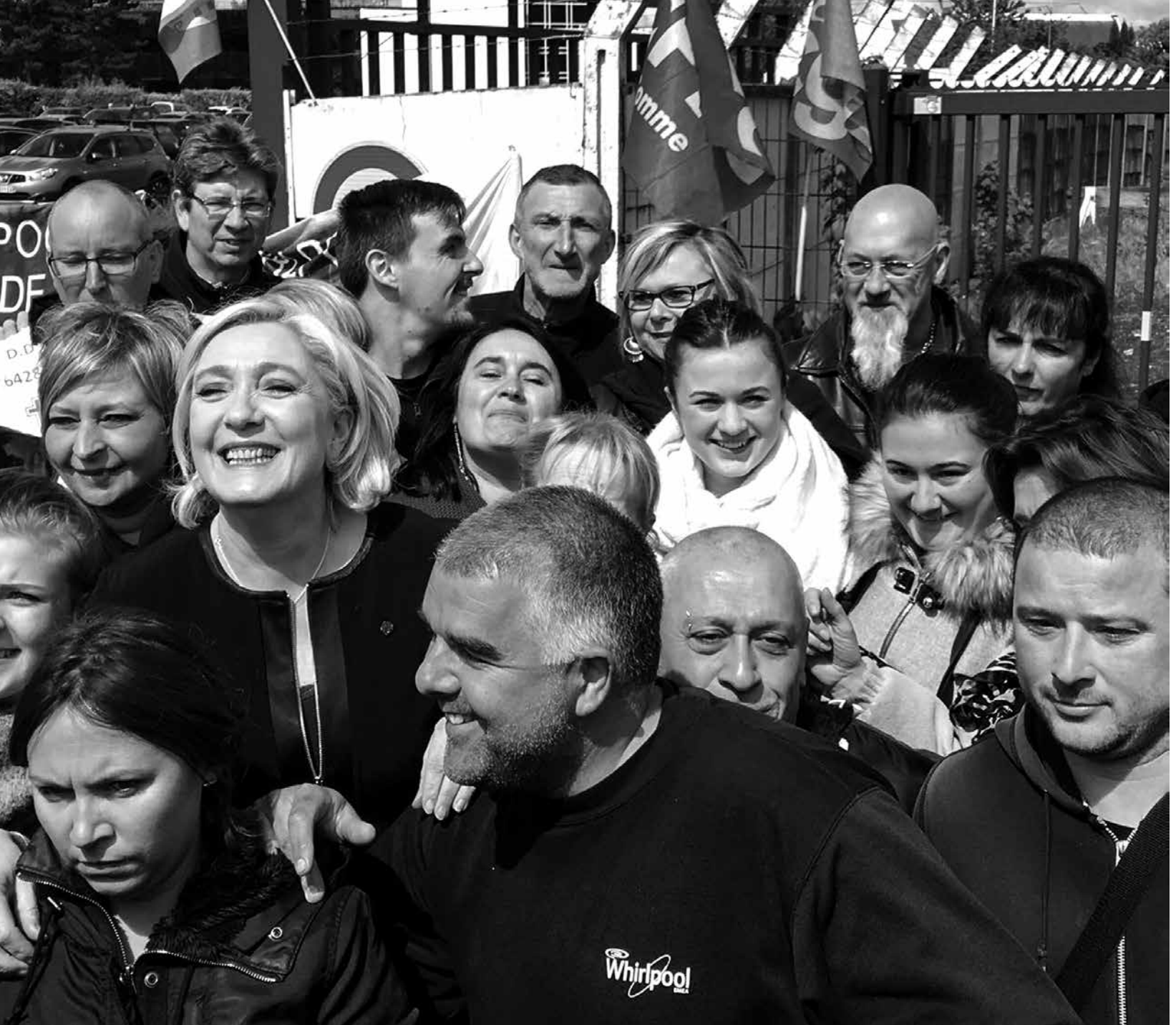
Marine Le Pen bij de met sluiting bedreigde Whirlpool-fabriek in Amiens, 26 april

en uitgekende processen en routines, waarvan de lopende band het symbool bij uitstek werd. De bedrijfsvoering van Ford stond model voor het kapitalisme uit die tijd. In dit 'fordisme' waren kapitaal en arbeid stevig met elkaar verstrengeld. Het massale productieproces was niet alleen gekoppeld aan de enorme fabriekshallen met hun zware onbeweeglijke machines, ook de arbeiders waren voor het leven gebonden aan de fabriek. Een verstandshuwelijk weliswaar, uit noodzaak en zelden uit liefde, maar des te meer waren kapitaal en arbeid tot elkaar veroordeeld.